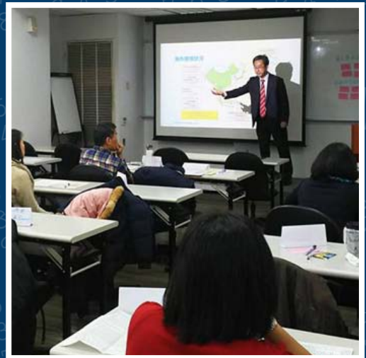
2017年12月 台湾現地企業を対象としたイベント風景